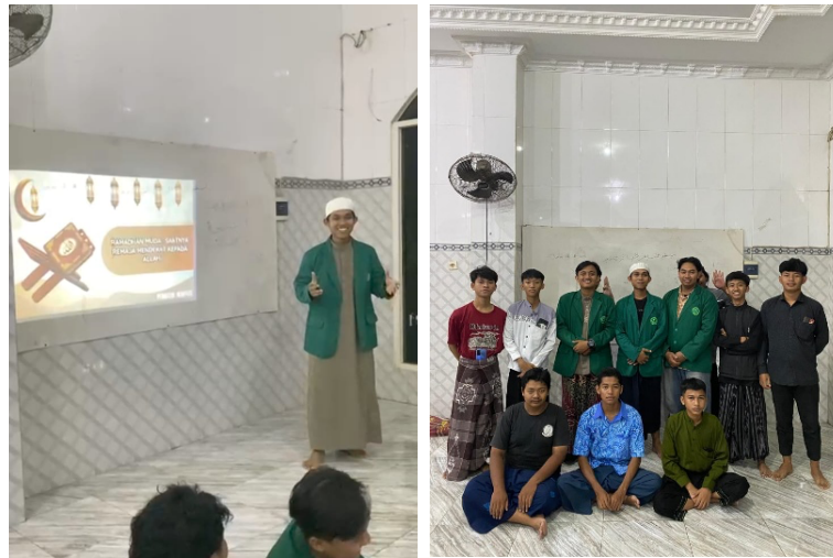
Gambar 2. Tahapan pelaksanaan inti kegiatan; (a) penyampaian materi oleh narasumber; (b) dokumentasi akhir kegiatan sebagai bentuk refleksi bersama

terhadap pengalaman pembelajaran. Representasi visual dari tahap ini ditunjukkan dalam gambar berikut, yang menggambarkan suasana kegiatan pada fase akhir sebagai simbol keterlibatan dan kebersamaan yang telah terbangun.